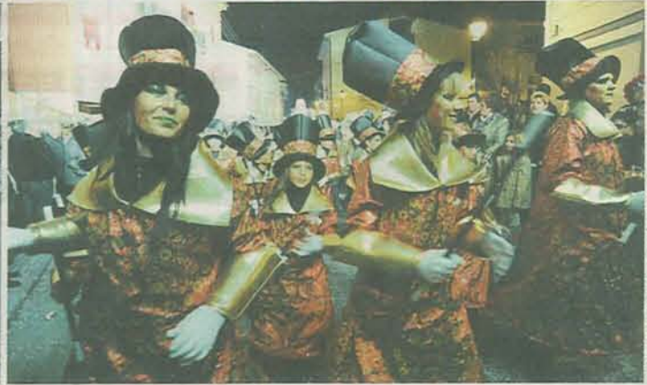
JORDI PUIG/ALBERT LLIMÓS/VICENC BIGAS